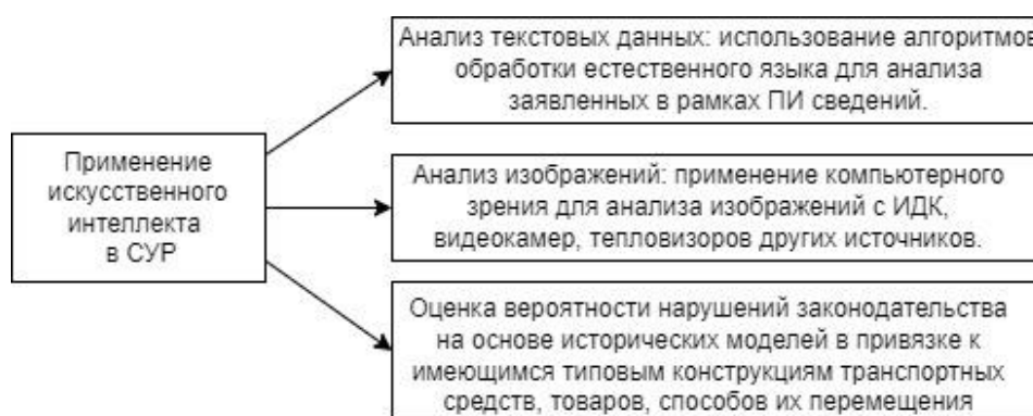
Рис. 1. Применение искусственного интеллекта в СУР в ИПП

Применение ИИ в интересах анализа управления рисками в ИПП (рис.1) позволяет осуществлять: