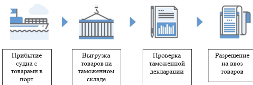
Рис. 1. Оформление прибытия импортных товаров в порту

ные товары могут быть ввезены в страну путем подачи декларации уполномоченному специалисту таможенной службы Кореи напрямую, либо с помощью таможенного брокера. Процедура таможенного оформления импортных товаров выглядит следующим образом. Импортер подает декларацию начальнику таможенного поста. Если декларация правильно заполнена и соответствует Закону о таможне Южной Кореи, то начальник таможенного поста принимает такую декларацию и разрешает выгрузку товаров на таможенном складе (рис. 1).