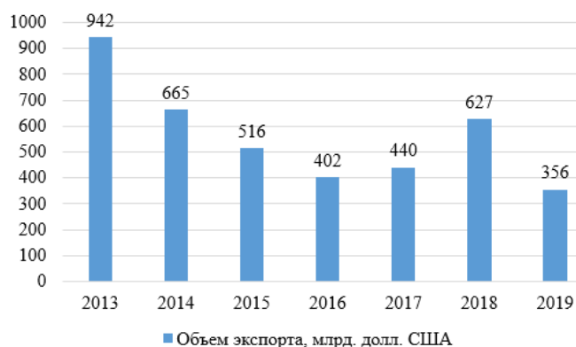
Рис. 1. Объемы экспорта российских изделий из металлов в Германию, 2013–2019 гг., млрд. долл. США [3]