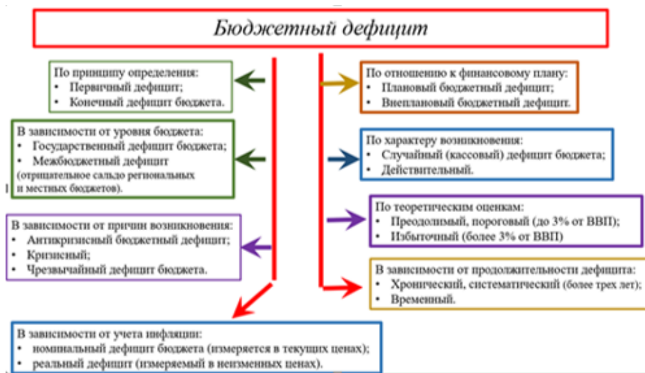
Рис. 3. Классификация бюджетного дефицита (рисунок автора)

Для обеспечения сопоставимости показателей различных бюджетов была разработана бюджетная классификация. В структуре двадцатизначного кода классификации источников финансирования дефицита бюджета вышеназванным дефицитам соответствуют разряды №12–13. Они могут принимать значения от «01» (т.е. федеральный бюджет) до «13» (т.е. бюджет городского поселения) (см рис. 2).